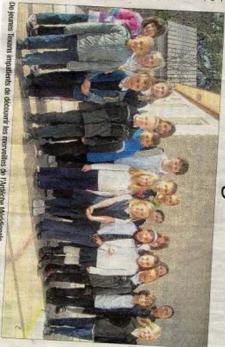
De jeunes Tenors impatients de découvrir les merveilles de l'ardèche Méridionale.