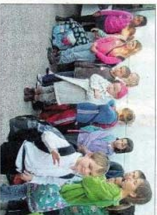
They are tired, but so glad to be in France (ils sont fatigués, mais si heureux d'être en France).